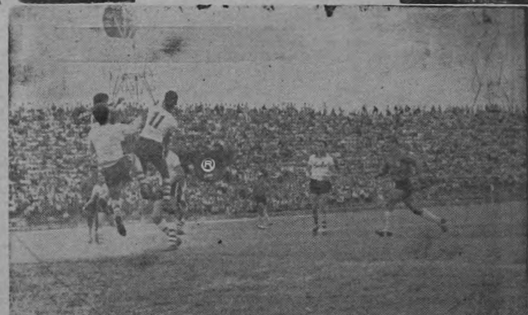
Fotografía tomada en el partido de ayer inter-selecciones de Cuba y Costa Rica

EN QUE CONSISTE EL CONCURSO: SANI - PINE Publicamos en esta página una instantánea tomada por nuestro fotógrafo Meza durante el partido de fútbol celebrado entre los equipos SELECCIONES de Cuba y Costa Rica. Aparecen en la fotografía varios jugadores de ambos bandos disputándose la bola, pero LA BOLA NO PUEDE VERSE porque fue hábilmente BORRADA EN EL ORIGINAL con que se hizo el cliché. Ahora bien, de acuerdo con las posiciones que tienen en el grabado los distintos jugadores y ayudado de su propia imaginación, lo único que tiene que hacer el lector que quiera participar en el concurso SANI-PINE es dibujar con cualquier lápiz, el tamaño aproximado de una bola de fútbol, en el sitio preciso en donde considere que debió encontrarse el balón que fue borrado de la foto. Una vez realizada tal operación, simplemente recorte la fotografía y la manda a LA REPUBLICA DEPORTIVA con su nombre y dirección. BASES DEL CONCURSO SANI-PINE 1.—Tienen derecho a participar todos los lectores de LA REPUBLICA DEPORTIVA. 2.—Dibuje una rueda en el grabado, en el lugar preciso en donde usted considera que se encuentra la bola.