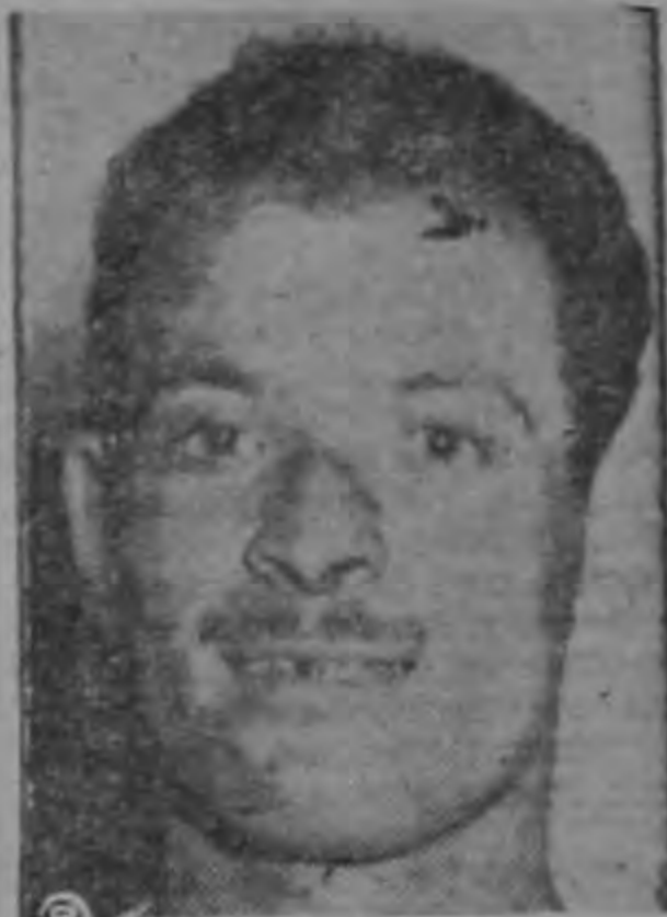
El Palmareño Solís es catalogado en México el mejor defensa.